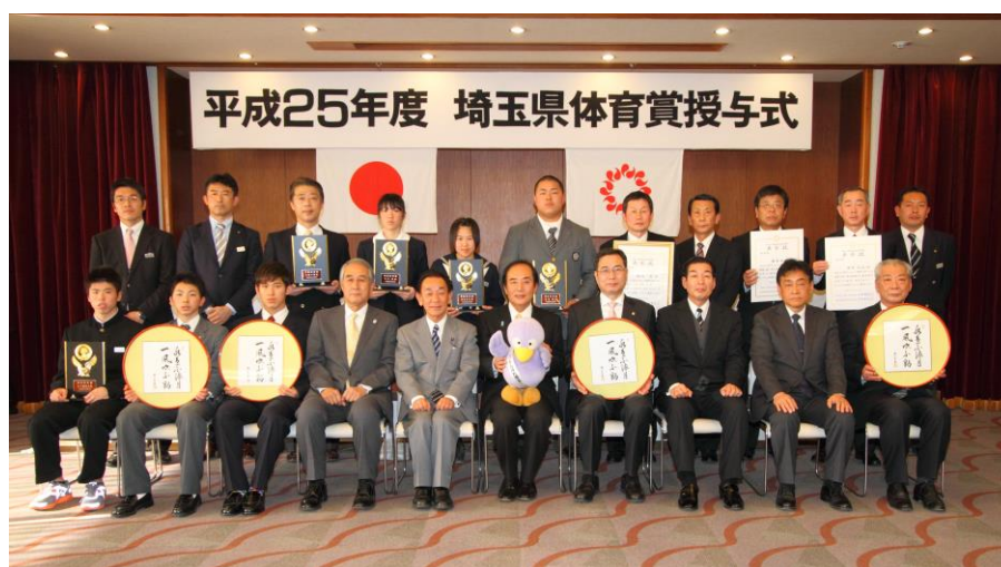
※平成25年度野口記念体育賞・押田記念体育賞受賞者