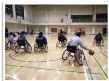
左：講演を聴く生徒たち 中央：練習中の生徒たち 右：ミニゲームを行う生徒たち