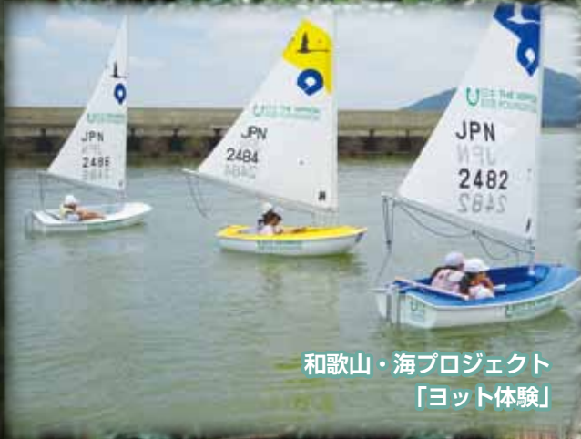
和歌山・海プロジェクト 「ヨット体験」

「主体的・対話的で深い学びを通して 自ら考え工夫していく力を身に付ける体育・保健体育学習」 ～ 自らが進んで運動(遊び)に取り組み、仲間とともに高め合う姿を求めて～