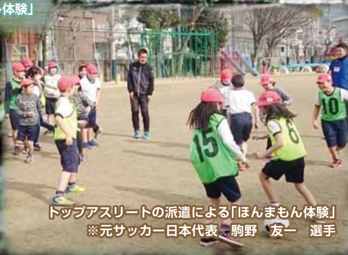
トップアスリートの派遣による「ほんまもん体験」 ※元サッカー日本代表 駒野 友一 選手