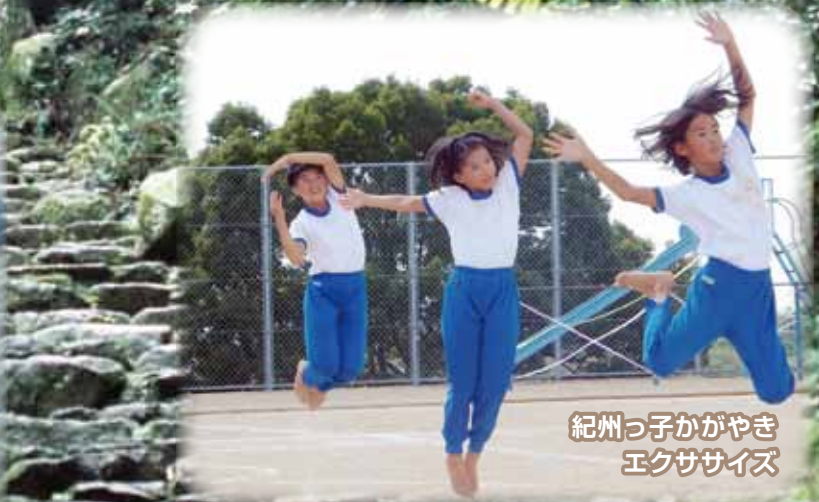
紀州っ子がやき エクササイズ